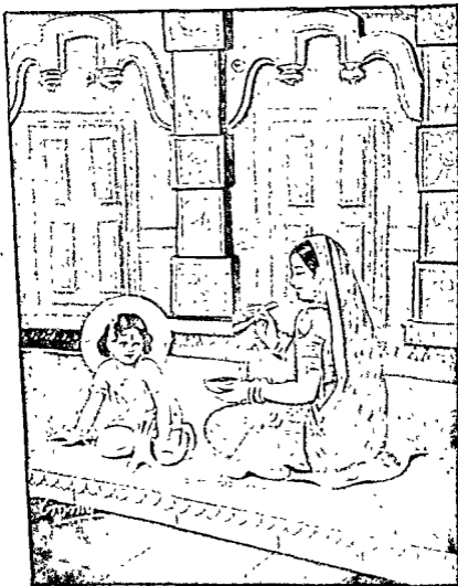
माता कौशल्या का राम को दूध पिलाना